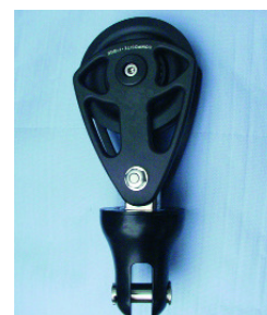
Emerillon de drisse