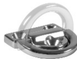
Pad eye mobile RF2436-XX