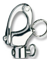
RF6170 pour BB