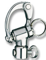
RF6171 pour BB