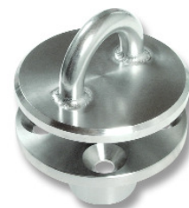
Pad eye amovible RF2433-XX RF2435-XX