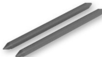
Crayons pour chariots