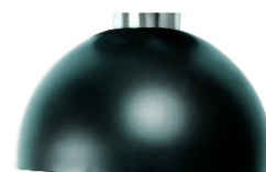
Sphère caoutchouc 90°