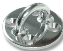
Pad eye RF2429-XX