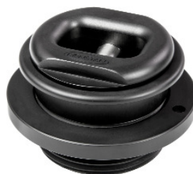
Pad eye textile amovible RF2437-XX