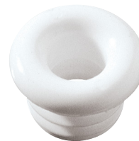
Ø 12,5 PNP39B