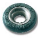
Ø 7 PNP182