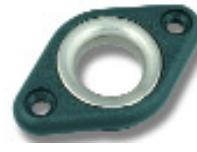
Ø 15,5 PNP261