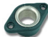
Ø 15,5 PNP262