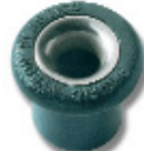
Ø 7 PNP183