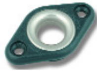
Ø 13 PNP258