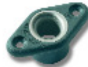
Ø 11 PNP189