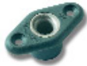
Ø 7 PNP187