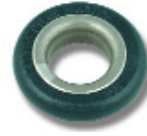
Ø 11,5 PNP255 Ø 13 PNP259