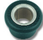
Ø 11,5 PNP256 Ø 13 PNP260