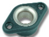
Ø 13 PNP257