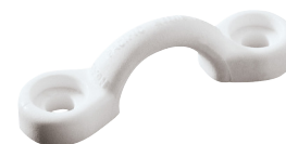
PNP49 - PNP48