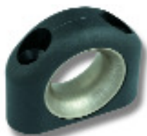
Ø 16 PNP124