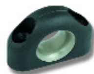
Ø 11,5 PNP122