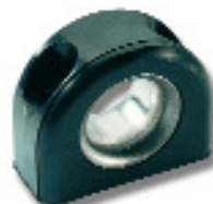
Ø 14 RF59 Ø 16 RF2358