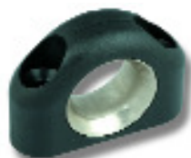
Ø 13,5 PNP123